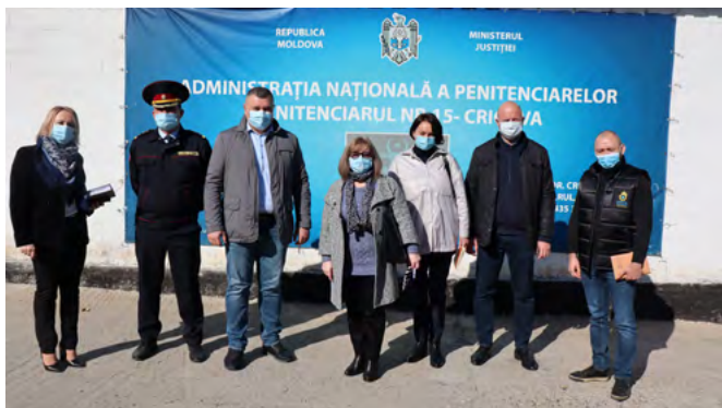
Membrii Comisiei drepturile omului și relații interetnice, în vizită inopritată la Penitenciarul nr. 15 din Cricova.