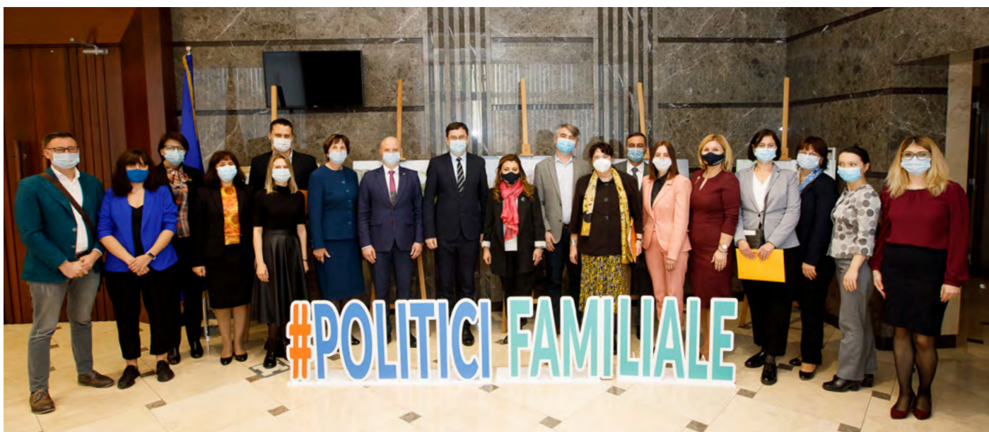
Reglementările naționale privind politicile familiale versus standardele europene, discutate pe platforma Comisiei protecție socială, sănătate și familie.